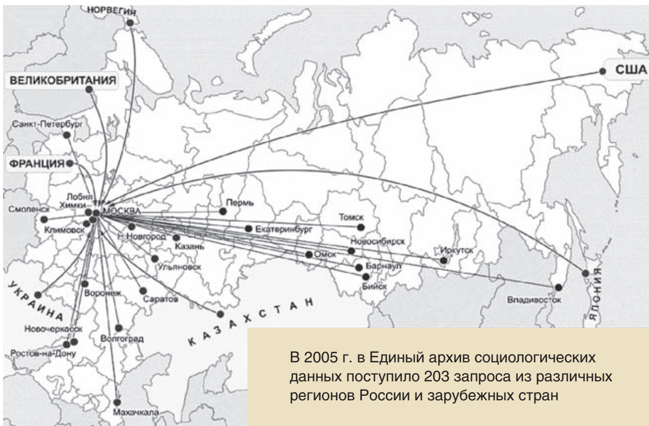
Рис. 1. География запросов, поступивших в Единый архив социологических данных