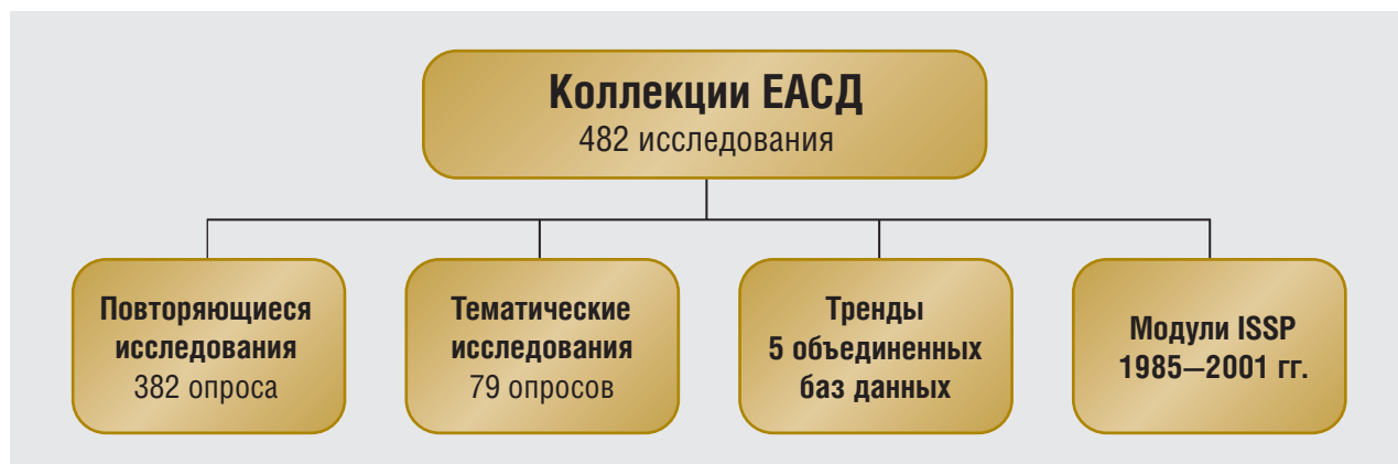
Рис. 2. Коллекции Единого архива социологических данных

Раздел “Тренды” содержит пять объединенных баз данных, каждая из которых включает материалы, накопленные за много лет. Например, в базу “Бюджеты времени сельского населения” вошли данные за 1975–1999 годы. Это системное исследование советской и постсоветской деревни, посвященное изучению сдвигов в использовании времени при изменяющихся условиях