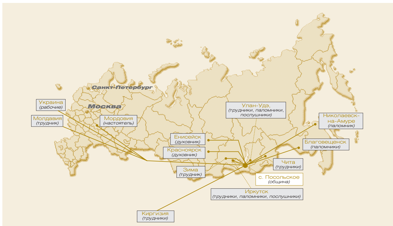
Рис. 1. Территориальное представление социальной сети общины православного монастыря (с. Посольское, Республика Бурятия)

На рис. 1 на примере одного из монастырей показано, откуда прибывают “участники” монастырской общины (территориальный разрез).