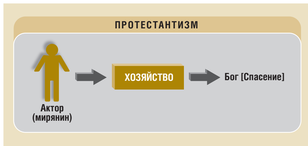
Рис. 2. Мотивация хозяйственной деятельности в протестантизме

Представить эту схему будет проще, сравнивая ее со схемой, описанной М. Вебером для протестантов кальвинистского толка. Протестантская схема состоит в следующем. Действующий (протестант) полностью оторван от Бога: Бог его не слышит, молитва Богу не имеет смысла. Часть людей изначально предизбрана к спасению, и эта предизбранность проявляется в мирской жизни в виде благоденствия, успеха. Самой простой единицей для измерения благоденствия полагается при этом внешний достаток, легко выражаемый в денежном эквиваленте. Соответственно кто благоденствует в миру, тот будет спасен. Далее Вебер предполагал, что каждый человек, находясь в такой ситуации, захочет проверить, предизбран он или нет. Способом проверить это является попытка честным трудом добиться благоденствия в этой жизни. Если человек успешен, значит, он избран. Таким образом, предельно простая схема (см. рис. 2) состоит в том, что хозяйство является средством на пути к Богу (спасению) 15 .